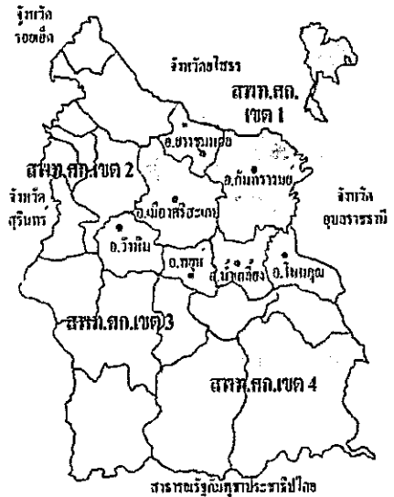
แผนที่แสดงเขตพื้นที่การศึกษาศรีสะเกษ