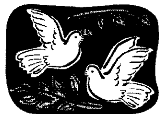
คำอธิษฐานเพื่อสันติภาพโลกหรือการพิภ

สามารถสอบถามเพิ่มเติมได้ที่ สำนักงานธนารักษ์พื้นที่ศรีสะเกษ