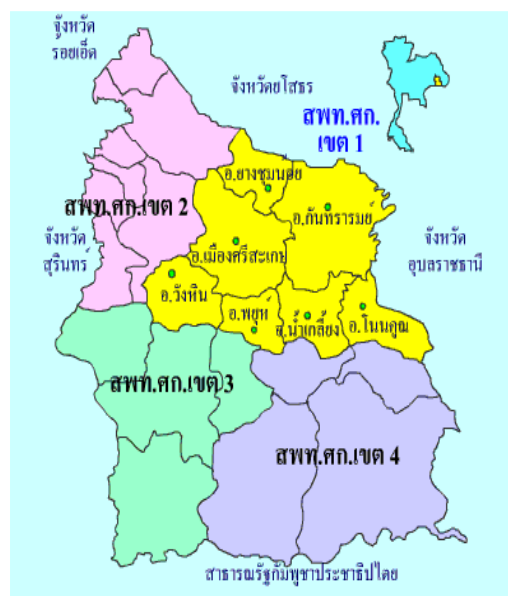
แผนที่แสดงเขตพื้นที่การศึกษาศรีสะเกษ