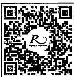
QR CODE สำหรับจองห้องพัก มหาวิทยาลัยศิลปากร