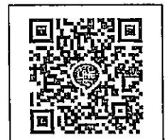
QR-Code เพื่อสอบถามข้อมูล