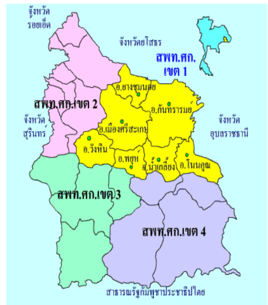
แผนที่แสดงเขตพื้นที่การศึกษาศรีสะเกษ