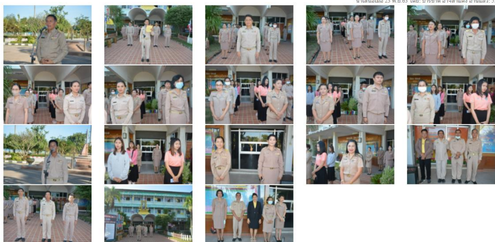
นำเสนอเมื่อ 23 พ.ย. 63 โดย: ปรีชาดี อาจสำแดง อ่านแล้ว: 53 ครั้ง