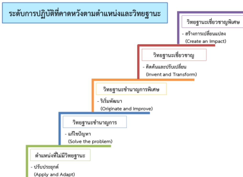
แผนภาพที่ 1 ระดับการปฏิบัติที่คาดหวังตามตำแหน่งและวิทยฐานะข้าราชการครูและบุคลากรทางการศึกษา ตำแหน่งผู้บริหารสถานศึกษา

8. จากกรอบแนวคิดข้างต้น สำนักงาน ก.ค.ศ. พิจารณาแล้วเห็นว่าผู้บริหารสถานศึกษาที่มีศักยภาพนอกจากจะต้องมีสมรรถนะในการปฏิบัติงานให้สูงขึ้นตามระดับวิทยฐานะที่คาดหวังแล้ว ยังต้องสามารถพัฒนาครูให้มีสมรรถนะเต็มตามศักยภาพ เพื่อร่วมขับเคลื่อนการพัฒนาคุณภาพการศึกษาด้วย จึงได้นำความคิดเห็นของนักวิชาการและผลการวิจัยที่เกี่ยวข้องมาจัดทำหลักเกณฑ์และวิธีการประเมินตำแหน่งและวิทยฐานะข้าราชการครูและบุคลากรทางการศึกษา ตำแหน่งผู้บริหารสถานศึกษา โดยผู้บริหารสถานศึกษาต้องมีการพัฒนาให้มีสมรรถนะในการปฏิบัติงานสูงขึ้น ตามระดับการปฏิบัติที่คาดหวังตามตำแหน่งและวิทยฐานะตามแผนภาพที่ 1 และกำหนดกรอบแนวคิดเพื่อวางระบบในการจัดทำหลักเกณฑ์และวิธีการฯ ตามแผนภาพที่ 2 และเชื่อมโยงระบบการประเมินต่าง ๆ ตามแผนภาพที่ 3 ดังนี้