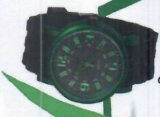
นาฬิกาธรรมดา แบบกัน