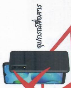
อุปกรณ์สื่อสาร

ทางด้าน การวัดและประเมินผลการเรียนรู้ เป็นการทดสอบเพื่อวัดความรู้ด้าน การวัดและประเมินผลของครู ทั้ง 4 ด้าน ประกอบด้วย 1) การวัดและประเมินผลการเรียนรู้ 8 กลุ่มสาระการเรียนรู้ 2) การวัดและประเมินคุณลักษณะอันพึงประสงค์ 3) การวัดและประเมิน การอ่าน คิดวิเคราะห์ และเขียน และ 4) การใช้ผลการประเมินเพื่อพัฒนา การเรียนรู้ของผู้เรียน