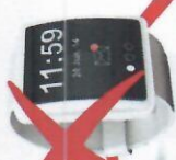
นาฬิกาอัจฉริยะ (Smart watch)