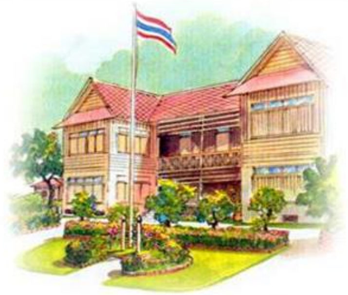
Education Area Management Support System ระบบสนับสนุนการบริหารจัดการสำนักงานเขตพื้นที่การศึกษา Smart Area