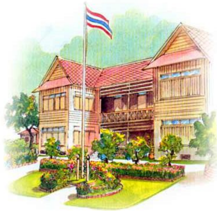
Education Area Management Support System ระบบสนับสนุนการบริหารจัดการสำนักงานเขตพื้นที่การศึกษา Smart Area

***การรับ-ส่งหนังสือ ภายนอก ออกเลขหนังสือนำส่ง (ในระบบ AMSS++)***