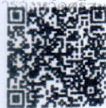
สิ่งที่ส่งมาด้วย ๒