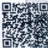
สิ่งที่ส่งมาด้วย ๑

ที่ทำการปกครองจังหวัด กลุ่มงานปกครอง โทร. ๐-๔๕๖๑-๑๕๕๑ โทรสาร ๐-๔๕๖๑-๒๗๘๖