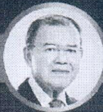
Dr. Supachai Panitchpakdi Former Secretary-General of UNCTAD and Former Director-General of the World Trade Organization (WTO)