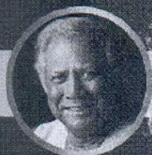
Prof. Muhammad Yunus (To be confirmed)