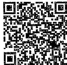
ใบสมัครและเอกสารโครงการฯ