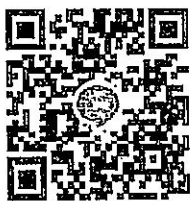
กลุ่มหลักสูตร THE CXO ๒๐๒๓

ประธานสมาพันธ์แพลตฟอร์มการศึกษาและอาชีพแห่งประเทศไทย