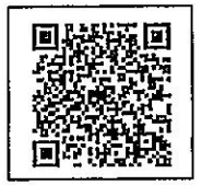
QR-Code เว็บไซต์ QR-Code เพื่อสอบถามข้อมูล