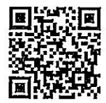
QR-Code เพื่อจองห้องพัก

การสำรองห้องพัก สามารถสแกน QR-Code สำหรับจองห้องพักของโรงแรมรอยัล ริเวอร์ บางพลัด กรุงเทพฯ โทรศัพท์: ๐๒-๔๒๒-๙๒๒๒ E-mail : rsvn@royalriverhotel.com