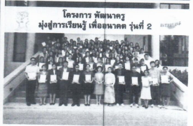
โครงการ พัฒนาการ มุ่งสู่การเรียนรู้ เพื่ออนาคต รุ่นที่ 2