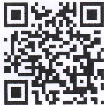
Facebook Thai Labour Market Information