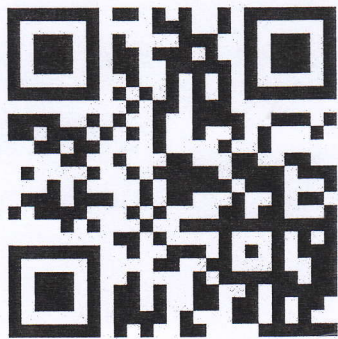
Website กองบริหารข้อมูลตลาดแรงงาน