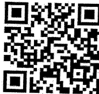
คุณสมบัติการคัดเลือก