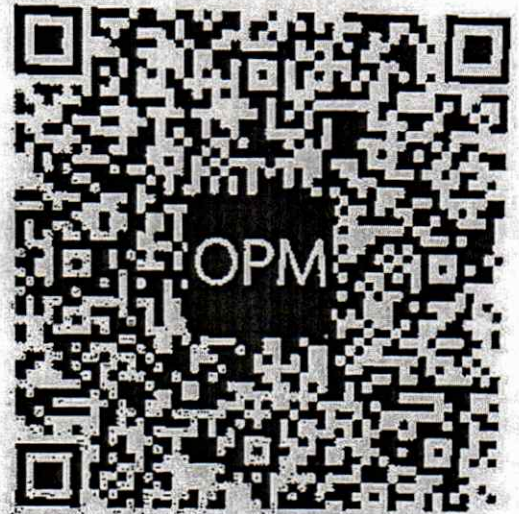
ตราสัญลักษณ์ฯ