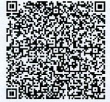
ประกาศรับสมัครฯ

รองผู้อำนวยการสำนักงานเขตพื้นที่การศึกษา ปฏิบัติราชการแทน ผู้อำนวยการสำนักงานเขตพื้นที่การศึกษาประถมศึกษาสระแก้ว เขต ๑ ๒๕.๘.๖๗