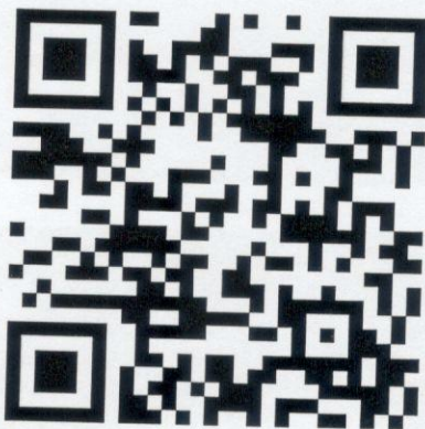
แผนที่ทางไปค่ายลูกเสือจังหวัดเชียงรายที่ ๒