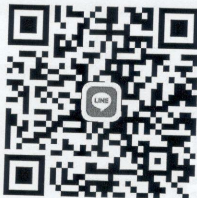
ไลน์กลุ่ม