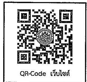
QR-Code เว็บไซต์

๓) ขอสงวนสิทธิ์การเข้าฟังบรรยายสำหรับผู้เข้าร่วมการฝึกอบรมที่ผ่านการลงทะเบียนกับทางมหาวิทยาลัยเท่านั้น