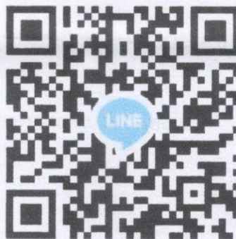
QR Code กลุ่มผู้เข้าร่วมกิจกรรม

: หรือแจ้งการโอนและแบบตอบเข้ามาในกลุ่มไลน์ “ปันชมค่ายเพื่อน้อง” ตามคิวอาร์โค้ด