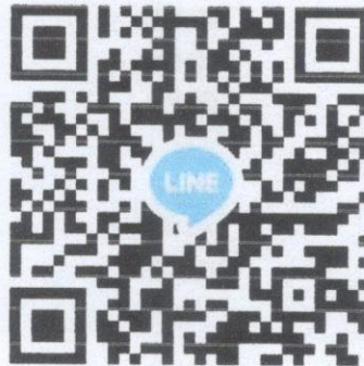
QR code กลุ่มไลน์ ปันชมค่ายเพื่อน้อง

๙. หากโอนเงินเข้าร่วมกิจกรรม หรือบริจาค แล้ว กรุณาแจ้งการโอน พร้อมสลิปการโอน ตามหมายเลข โทรศัพท์ผู้ติดต่อ/ประสานงาน มูลนิธิฯ หรือ เพื่อความสะดวกในการติดต่อ ประสานงาน กรุณาสแกน เข้าร่วมในกลุ่มไลน์ “ปันชมค่ายเพื่อน้อง”